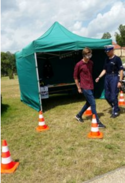
"Rusz głową" #1