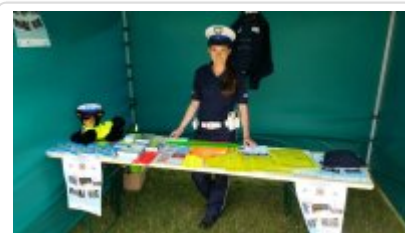
"Rusz głową" #3