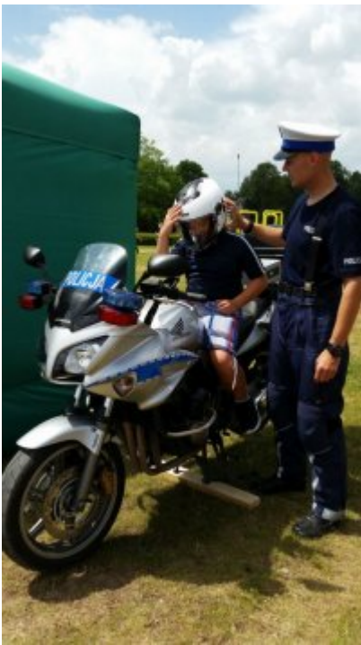
"Rusz głową" #4