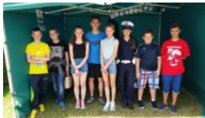
"Rusz głową" #5