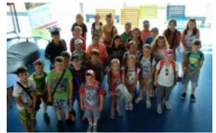
"Rusz głową" #6