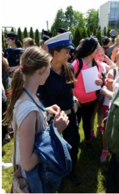
"Rusz głową" #11