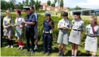
"Rusz głową" #10