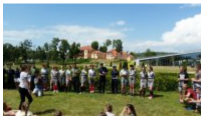
"Rusz głową" #8