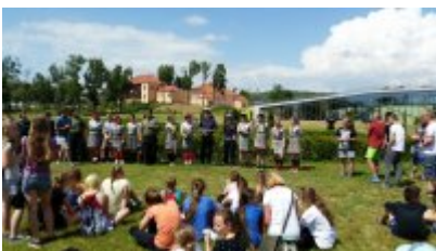
"Rusz głową" #7