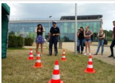
"Rusz głową" #2