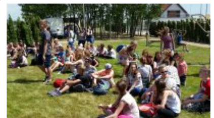
"Rusz głową" #9