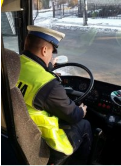
Policjant w trakcie kontroli