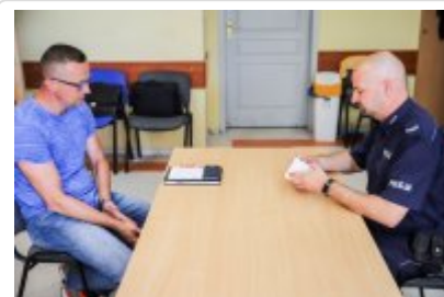
Zawody Dzielnicowy Roku