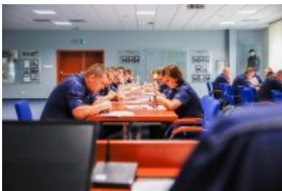
Zawody Dzielnicowy Roku