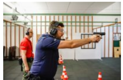
Zawody Dzielnicowy Roku