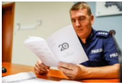
Zawody Dzielnicowy Roku