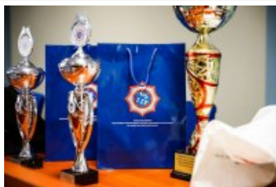
Zawody Dzielnicowy Roku