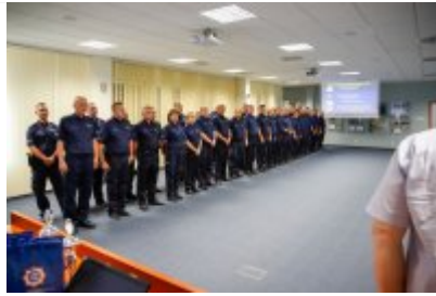
Zawody Dzielnicowy Roku