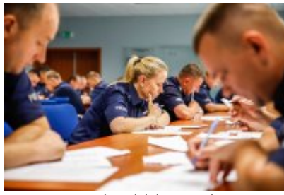
Zawody Dzielnicowy Roku