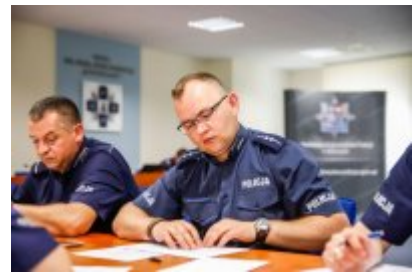
Zawody Dzielnicowy Roku