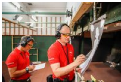
Zawody Dzielnicowy Roku