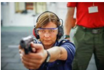
Zawody Dzielnicowy Roku