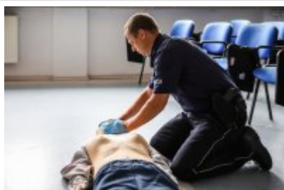
Zawody Dzielnicowy Roku