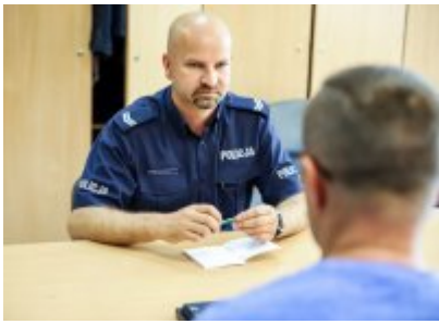
Zawody Dzielnicowy Roku