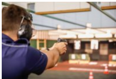
Zawody Dzielnicowy Roku