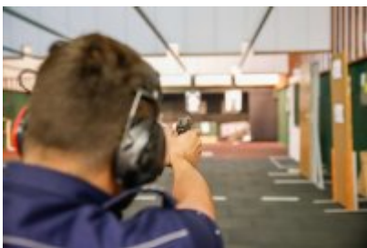
Zawody Dzielnicowy Roku