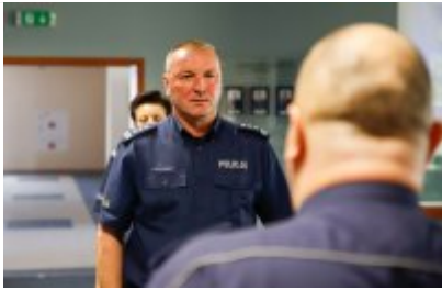
Zawody Dzielnicowy Roku