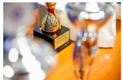
Zawody Dzielnicowy Roku