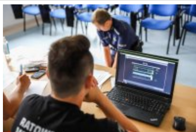
Zawody Dzielnicowy Roku