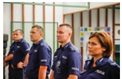
Zawody Dzielnicowy Roku