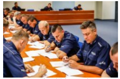
Zawody Dzielnicowy Roku