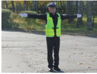
Odpowiednik sygnału zielonego - ruch otwarty z prawej i lewej strony policjanta