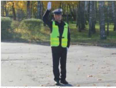
Odpowiednik sygnału żółtego - nastąpi zmiana kierunków ruchu