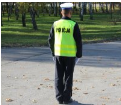
Policjant stojący przodem lub tyłem do kierowcy - odpowiednik sygnału czerwonego