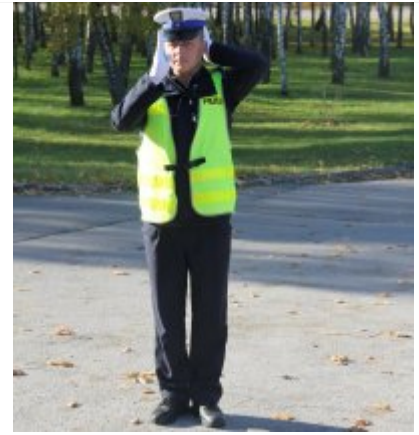
Otwarcie ruchu dla pojazdów z prawej i lewej strony policjanta - odpowiednik sygnału zielonego