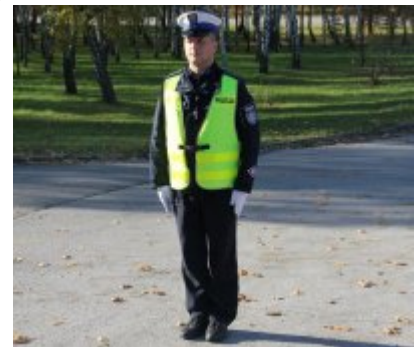
Policjant stojący przodem lub tyłem do kierowcy - odpowiednik sygnału czerwonego