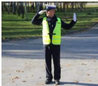
Ruch otwarty dla skręcających w lewo i jadących na wprost od strony prawej policjanta. Jadący na wprost z lewej strony policjanta - odpowiednik sygnału czerwonego