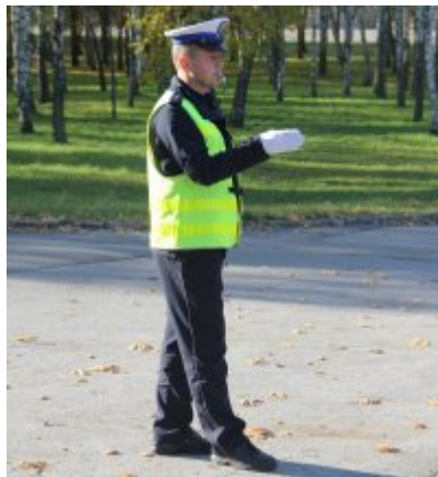
Ruch otwarty dla skręcających w lewo i jadących na wprost od strony lewej policjanta. Jadący na wprost z prawej strony policjanta - odpowiednik sygnału czerwonego.