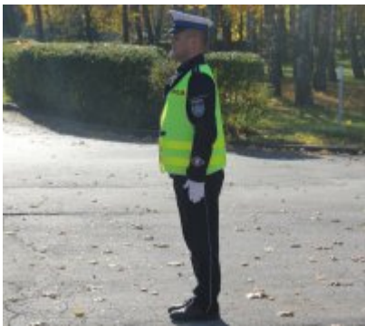
Policjant stojący do kierowcy bokiem prawym lub lewym - światło zielone